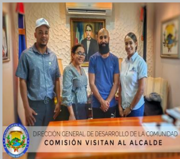
DIRECCIÓN GENERAL DE DESARROLLO DE LA COMUNIDAD COMISIÓN VISITAN AL ALCALDE